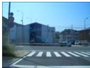
突き当たりの「多門町大門」を左折します。徒歩圏まで来ました。