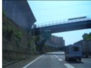
高丸 舞子 出口500mと記載があります。トラックで看板を見落とさないように。