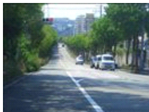
スピードの出し過ぎにご注意。安全運転でお越し下さい♪