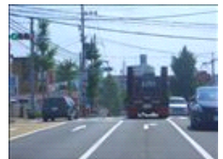
右手にもっこすなどを過ぎ、数秒で右折です。行き過ぎに注意。