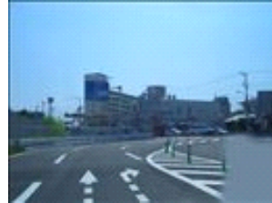
出口の交差点を右に曲がりますので、右折レーンへ入ります。結構曲がってます。