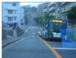
あとは道なりに真っ直ぐです。お肉のいい匂いがしてきました？