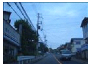
正面に焼肉亭の看板が見えてきました。もうすぐです♪