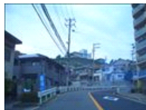
頑張って登って、お腹を空かせてお越し下さい(^o^)