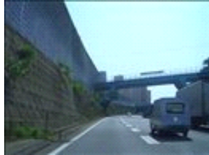
看板が見えたら、登坂車線（一番左）へ寄って下さい。車間距離を空け、ゆっくりどうぞ

高丸ICを下りて右側に寄っておきます。出て直ぐの交差点を大きく右折。直後の「高丸西」交差点を左折。道なりに真っ直ぐ下っていきます（約1.4Km）。突き当たりの丁字路「多門町大門」を左折。第二神明の高架を越えて約200m先のの交差点「南多聞台口」を右折。道なりに真っ直ぐ登って約360mで正面に焼肉亭の看板が見えます。道路を挟んで看板側（向かって右手）は駐車場、向かって左手側が『焼肉亭垂水店』となっております。（駐車場は店舗前にもございますが、少々区画が狭いので、大き目のお車の場合は右手駐車場が宜しいと思います）