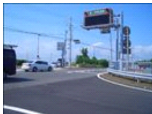
右側を見た所です。白い車の向かう方向へ行きます。