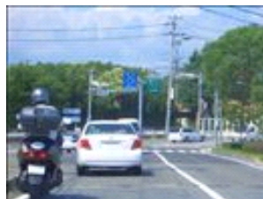
50m程で突き当たりの「高丸西」交差点を左折です。