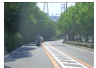
ずっと道なりに真っ直ぐ下っていきます。（約1.4Km）