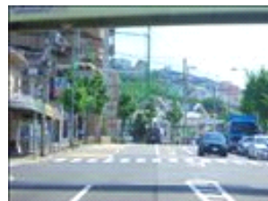
高架を超えて直ぐの交差点も同じ名前です！？