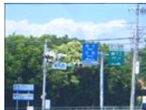
舞子・多聞方面へ向かいます。交通量が多いのでご注意ください！