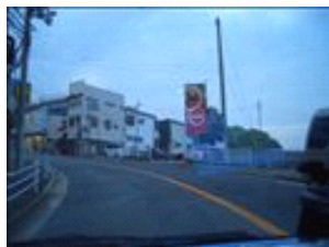
対向車に気をつけて看板側の駐車場へどうぞ。