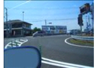
見え難いですが、右斜め前方向ではなく、しっかり右折しなければいけません。