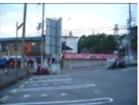
地面に焼肉亭と書いてあるところへお止め下さい。