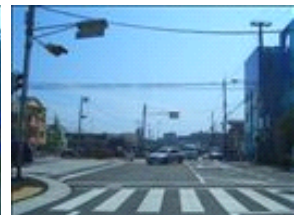
この丁字路を左折してください。学校があります。飛び出し注意。