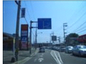
道なりに進んでください。飲食店が沢山ありますがガマンガマン。