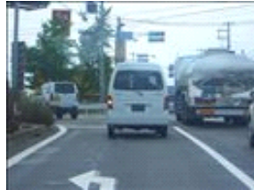
この交差点「伊川谷町漆山」を左折します。交通量が多いです。