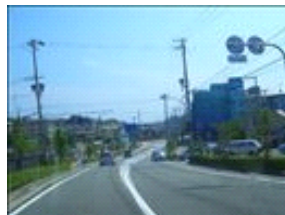
景色も良いですが、上の看板に注意しておいてください。