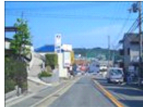
正面に焼肉亭の看板が見えてきました。もう少しです。