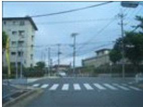
同じ交差点です。ここを超えると少し下っていきます。