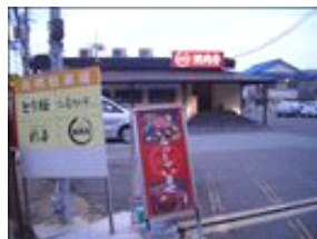
お店は道の反対側です。軽車両などはこちらの駐車場もご利用下さい。