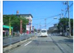
左側にお店がある交差点があります。まだ真っ直ぐです。