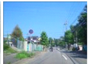
お店が数件並んでいます。その先の信号を左折です。