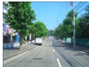
バスの停留所があります。もう少し進みます。