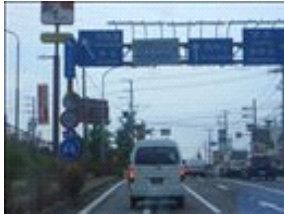
ICを下りるところです。一番左に寄っておいてください。

大蔵谷ICを下りて直ぐの交差点『伊川谷町漆山』を左折。真っ直ぐ下っていきます(約1Km)。右手に『あさぎり病院』がある交差点を左折。川を越えて2個目の交差点(交差点から約270m先)、朝霧興公園の角を左折。道なりに真っ直ぐ上って、その後下っていきます。(約2Km)セブンイレブンを過ぎて、少し行くと、右手に『焼肉亭垂水店』、左手に『焼肉亭駐車場』が見えます。(駐車場は店舗前にもございますが、少々区画が狭いので、大き目のお車の場合は左手駐車場が宜しいと思います)