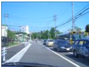
あさぎり病院の外観です。大きな病院で直ぐ判ると思います。