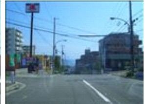
この辺りから下っていきます。この辺りは明石市になります。