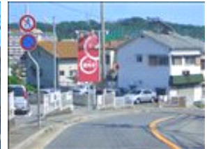
看板を拡大しました。看板左の駐車場をご利用下さい。