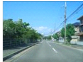
道なりに真っ直ぐ登っていきます。約2Kmあります。