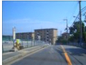
セブンイレブンの看板が見えます。道は少し曲がりくねっています。