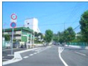
曲がってすぐの景観です。次の曲がるポイントまで約270m。