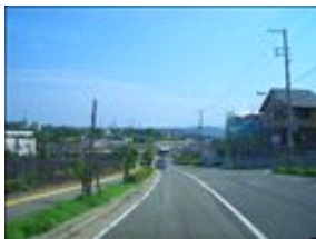
景色が綺麗で、天気の良い日はとても気持ちいい！！