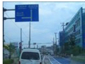
この看板です。右手にある青い建物が「あさぎり病院」です。